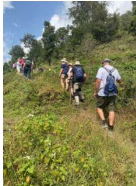
Vandring i Helambu

Hemfärd.- Vi flyger samma rutt med mellanlandning i Doha.